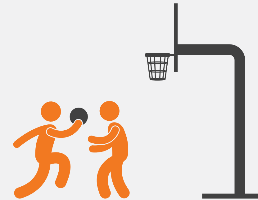
cancha deportiva multiusos