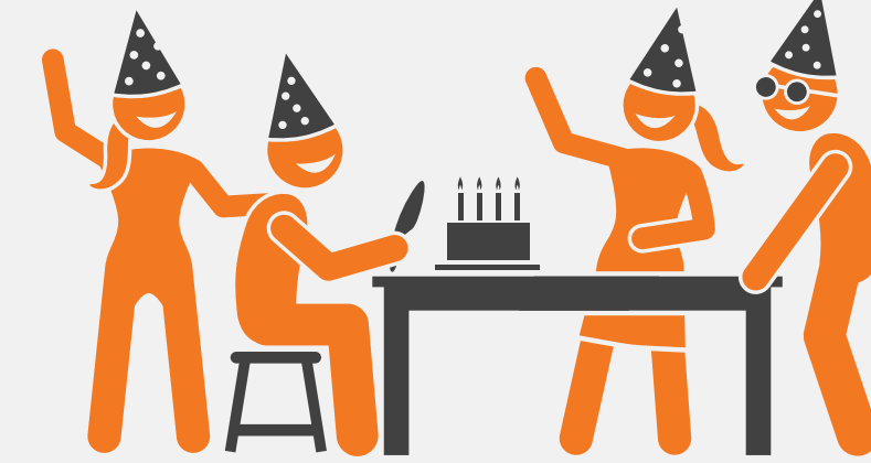
salón de fiestas